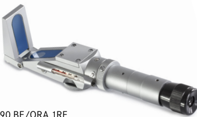
ORA 90 BE/ORA 1RE